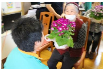
八代農業高校生ボランティア。ありがとうございます。

3月に一番、閲覧いただいた記事は、八代農業高校ジョブフェアに参加させていただき講義を行った内容でした。続いて八代農業高校生がボランティアについての様子でした。3月は、八代農業高校関連がトップとなりました。これからもデイサービス 暖暖の魅力を発信していきますのでよろしくお願いいたします。SNSでデイサービス 暖暖の魅力や様子、そして介護保険最新情報などをお届けしています。よろしくお願いいたします。