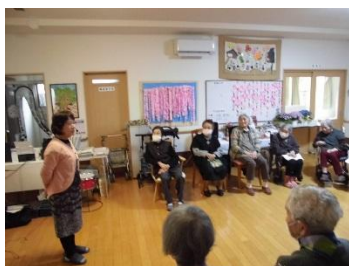
音楽療法。テーマは「春」。演奏に熱が入ります。