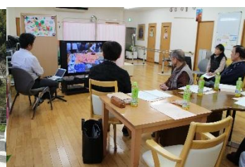
運営推進会議の様子